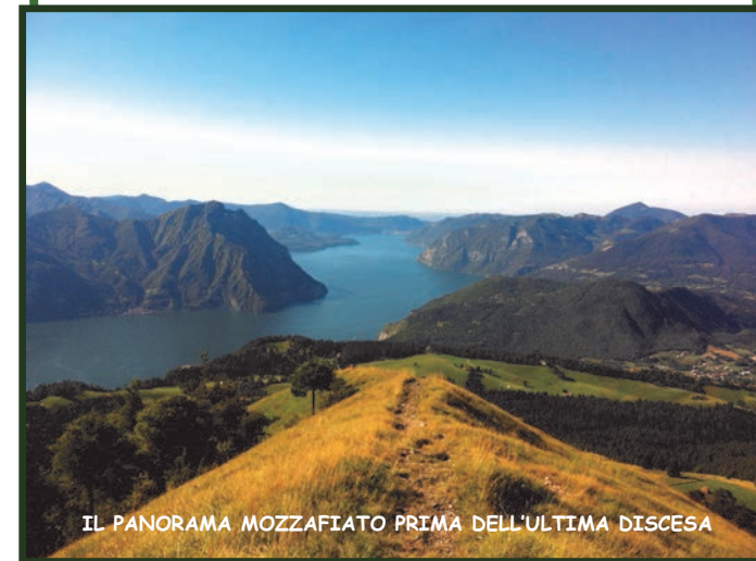
IL PANORAMA MOZZAFIATO PRIMA DELL'ULTIMA DISCESA

COSTO ISCRIZIONE € 6,00 PER INFO E ISCRIZIONI: PRO LOCO BOSSICO 035 968 365 www.bossico.com